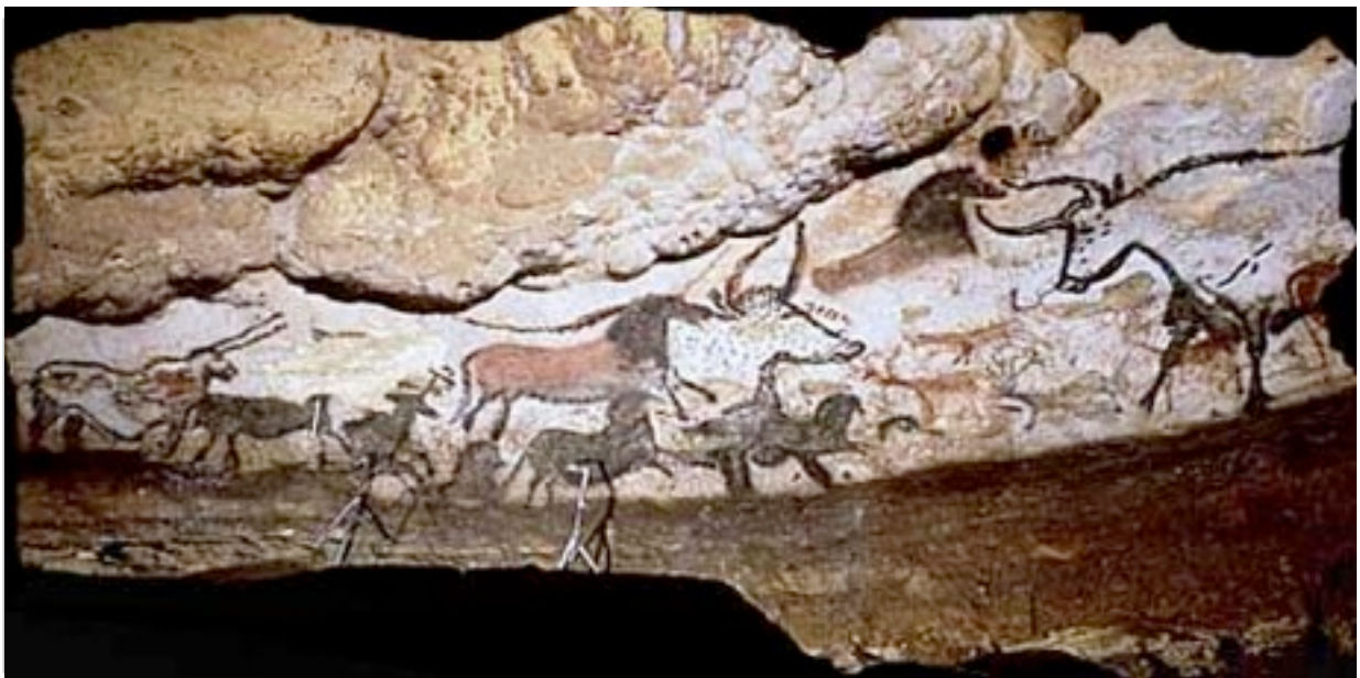
Peintures rupestres sur les murs de la grotte de Lascaux