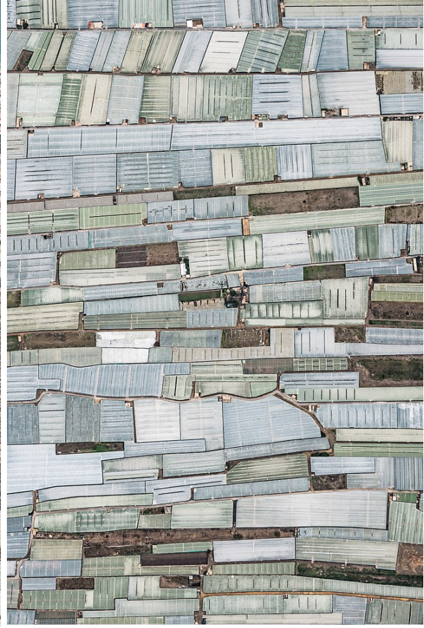
Ilustración 2: Mar de plástico