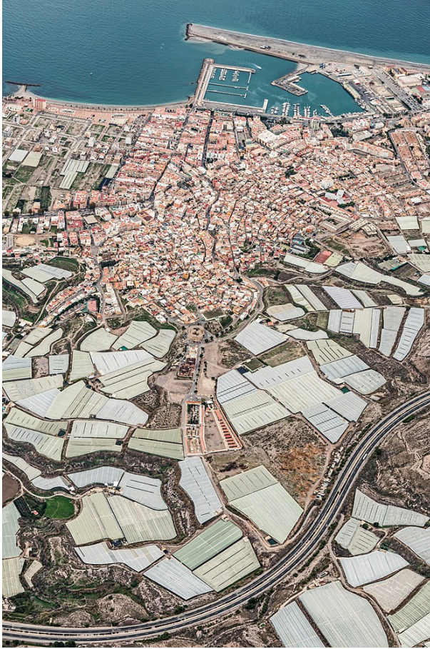
Ilustración 1: Mar de plástico