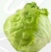
la lechuga = una ensalada