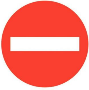
Interdit de passer