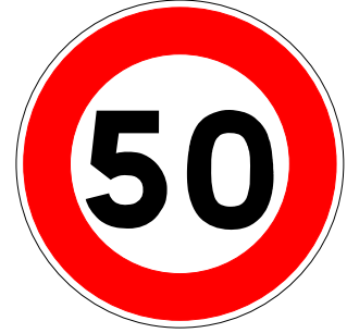
Limitation de vitesse