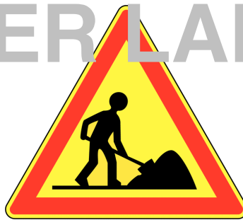
Danger : travaux