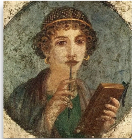
fresque dite de Sappho (fresque romaine, Pompéi, I er siècle ap. J.-C.)

Le drapé et la posture mettent en valeur un idéal de grâce et d'harmonie : la femme apparaît comme une figure idéalisée (souvent divine ou symbolique).