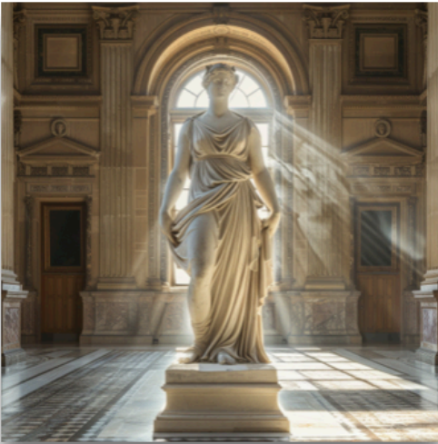
Statue d'une muse (inspiration gréco-romaine)

Dans l'Antiquité gréco-romaine, représenter la femme ne consiste pas à représenter le réel : l'art recherche souvent un idéal. On parle de canon esthétique : un ensemble de règles implicites (proportions, posture, gestes, vêtements, accessoires) qui définit ce qu'une époque juge beau et harmonieux.